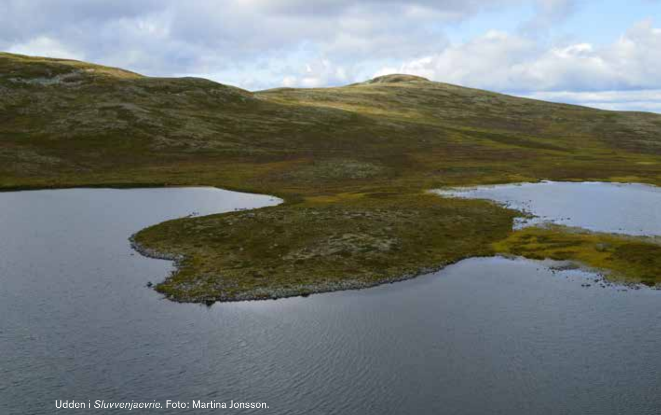
Udden i Sluvvenjaevrie .