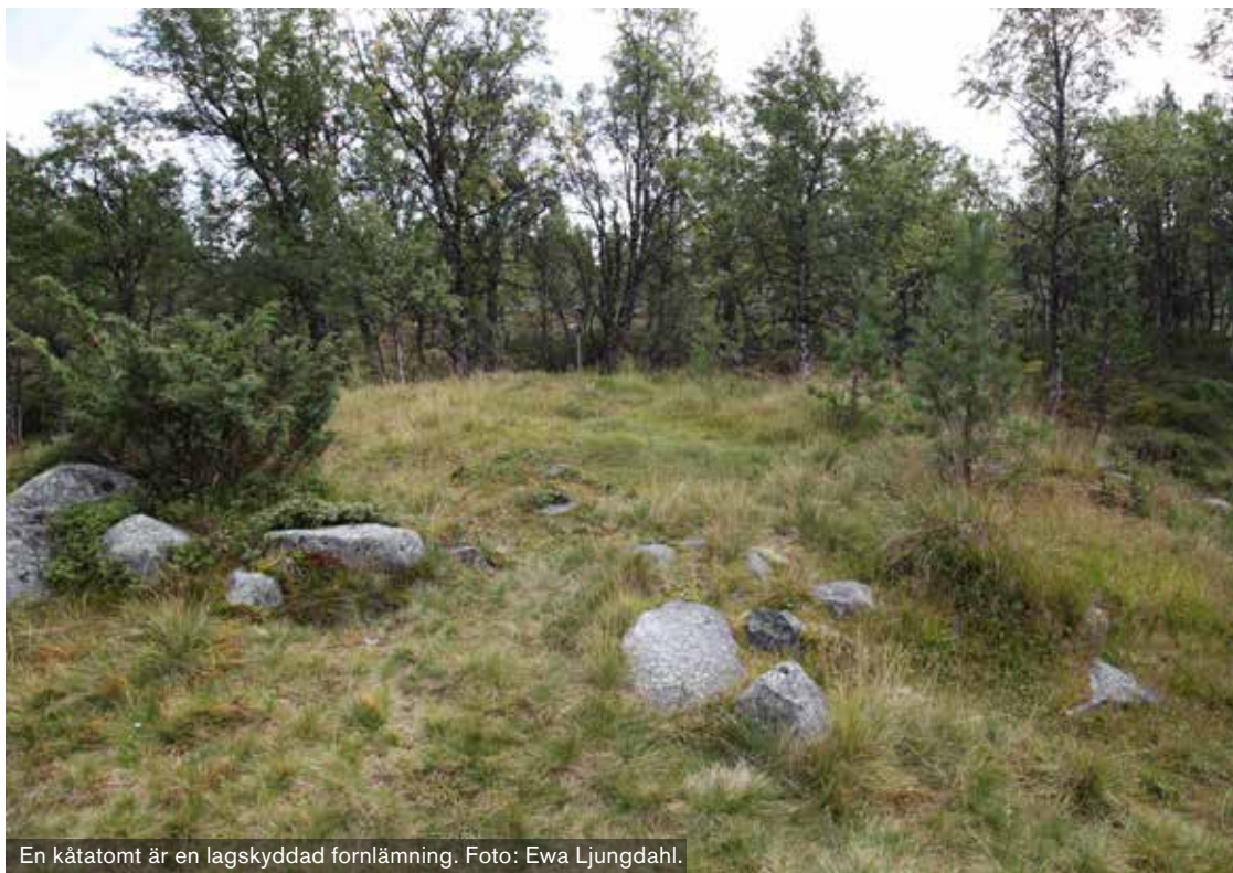
En kåtatomt är en lagskyddad fornlämning.

ningen. Lagskyddet gäller automatiskt, det behövs alltså ingen särskilt beslut för att det ska träda i kraft. Exempel på vanliga fornlämningar i samiska miljöer är kåtatomter, renvallar, härdar, mjölkgropar, bengömmor, gravar och offerplatser.