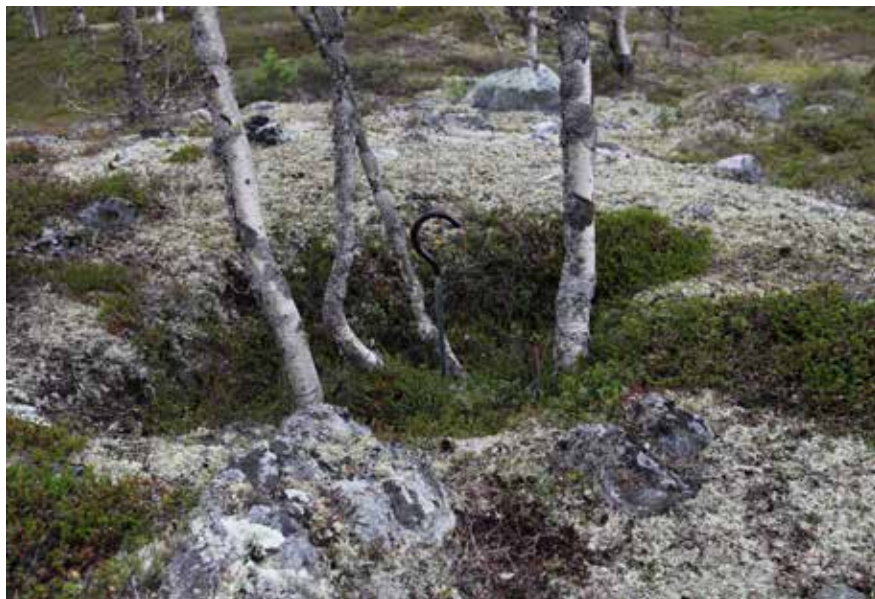
En boerne (mjölkgrop) där renmjölken förvarades i en tråkagge under vintern.

Men det samiska kulturlandskapet rymmer också dimensioner som inte lämnar några fysiska spår. Alla de platser som har speciell betydelse för människor och djur, skohömyrar, fiskeställen och hjortronmyrar; minnen, sägner och traditioner; de gamla samiska namnen på fjäll och tjärnar, allt sådan faller i glömska när ingen längre kan berätta.