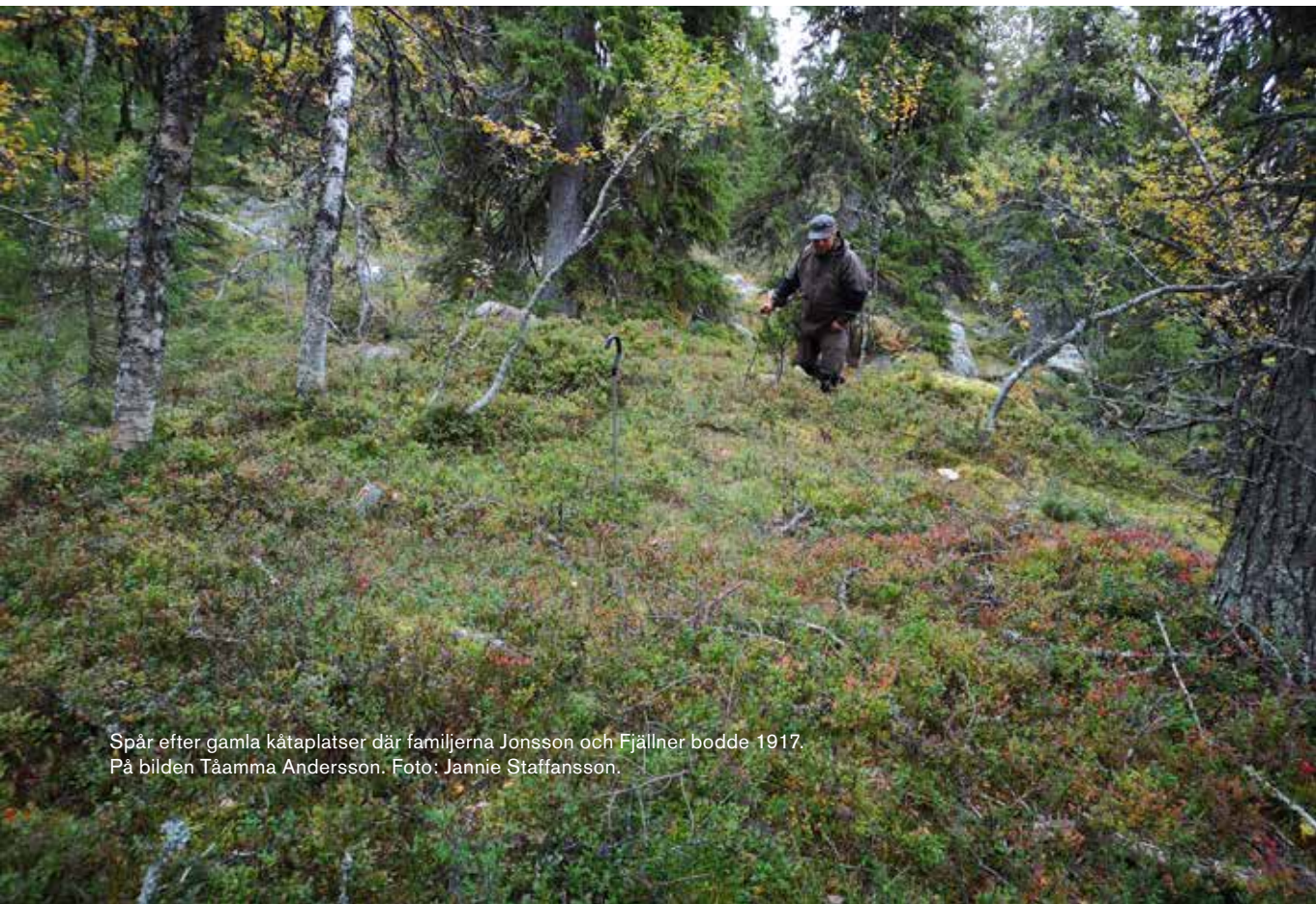
Spår efter gamla kåtaplats där familjerna Jonsson och Fjällner bodde 1917. På bilden Tåamma Andersson.

Vistet sträcker sig till en längd av ungefär 500 meter på Sluventjahke sydvästra sluttning mot sjön Jartanjaevrie . Vistet ligger i barrskogen på ett par små terasser i sluttningen ungefär 600 meter från sjön och kåtaplatserna ligger utspridda längs en stig som går mellan vistet i Noffeldaelie , sju kilometer och Särhve , tolv kilometer. Ovanför vistets östra del ligger