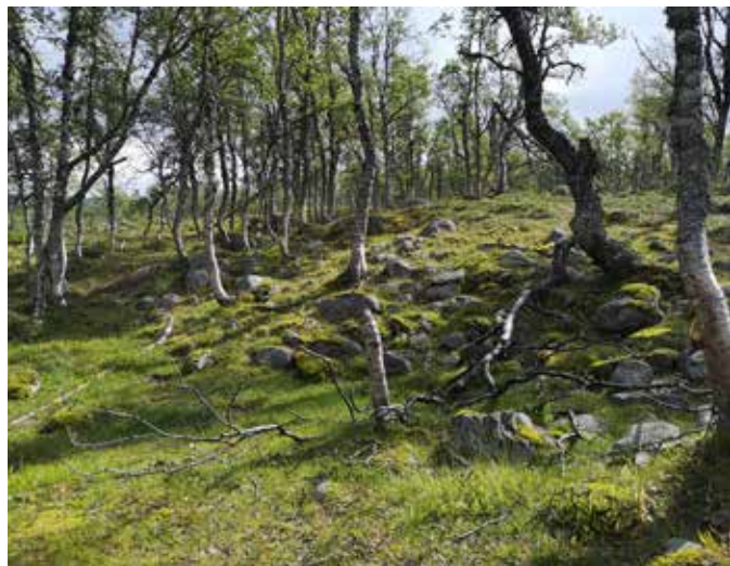
Stenar har röjts från aevtie (mjölkkningsvallen).

Utifrån fynden kan man anta att härden användes någon gång under tiden 1600- till 1800-talet. Blykulan anger en bakre tidsgräns eftersom blykulor till lodbössor började användas mer allmänt under 1600-talet. Myntet från 1771 ger ytterligare vägledning, men boplatsen kan naturligtvis ha använts långt