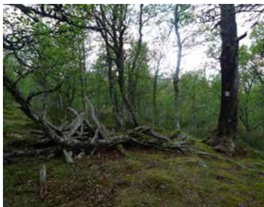
Förfallen bostadskåta i Gäblejohke.

Noffeldaelie är ett gammalt sommarviste där flera av idresamerna genom tiderna haft kåtor och renvallar. Det finns många lämningar från trädgränsen ned till strandkanten, men i dag syns inte längre boplatserna vid strand-