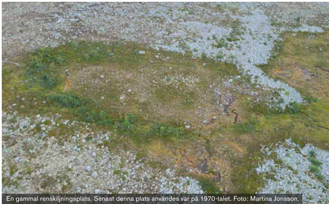
En gammal renskiljningsplats. Senast denna plats användes var på 1970-talet.