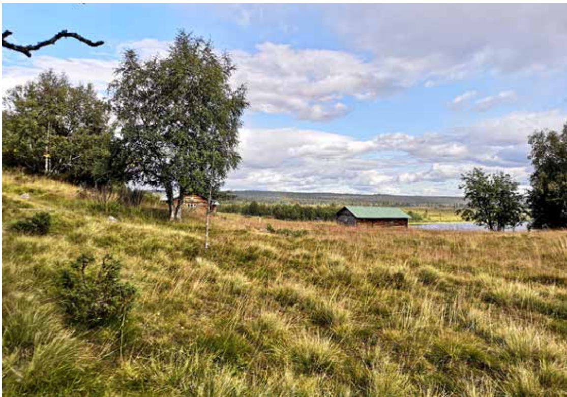
Gammalgården i Särhve , som liksom många nybyggen togs upp på renvallar där samerna hade mjölkat vajorna.

Täkten till nybygget Särhve som togs upp ungefär 1815 hade tidigare använts som renvall av samerna. Enligt sägnen brändes gården ner tre gånger av samerna, som inte ville ha nybyggare i fjället. Men med tiden accepterade man varandra och relationerna blev förhållandevis goda och man hade ömsesidig nytta av varandra.