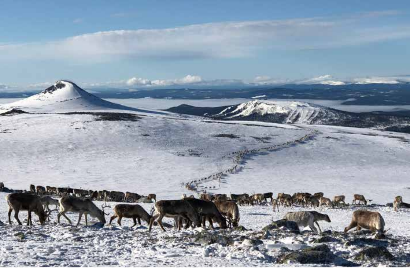
Renar med Städjan i bakgrunden.