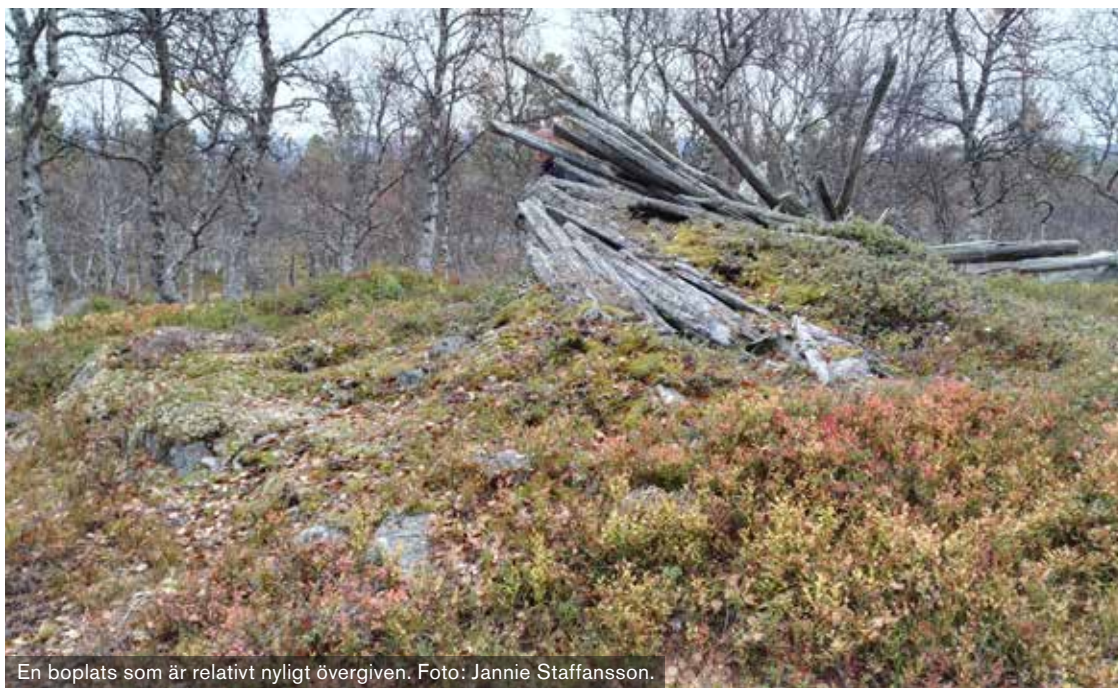
En boplatser som är relativt nyligt övergiven.

Under ett utredningsarbete 1913 gjorde jägmästare Eric von Sydow en rundresa bland samebyarna. Ett syfte med besöken var