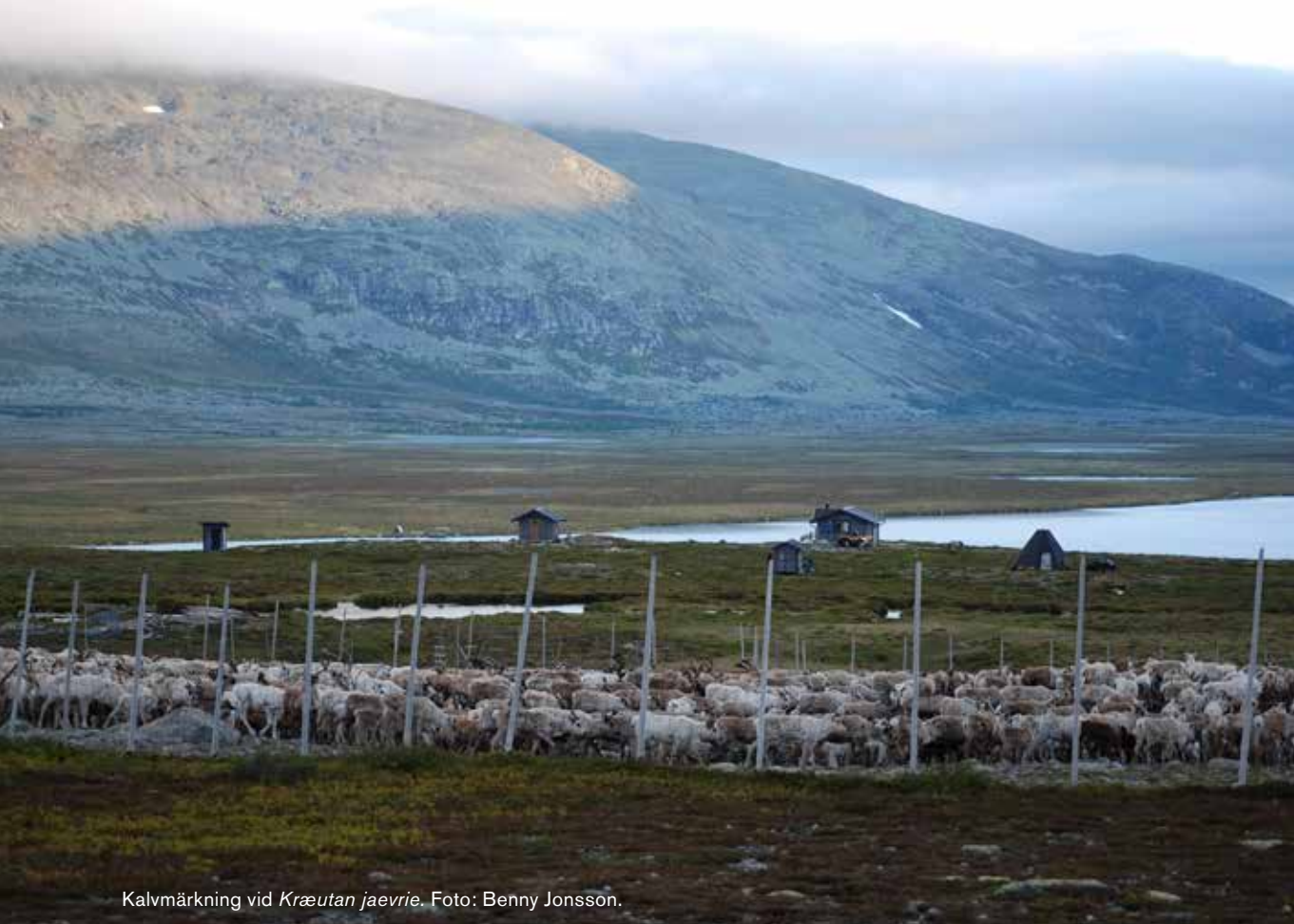
Kalvmärkning vid Kræutan jaevrie .