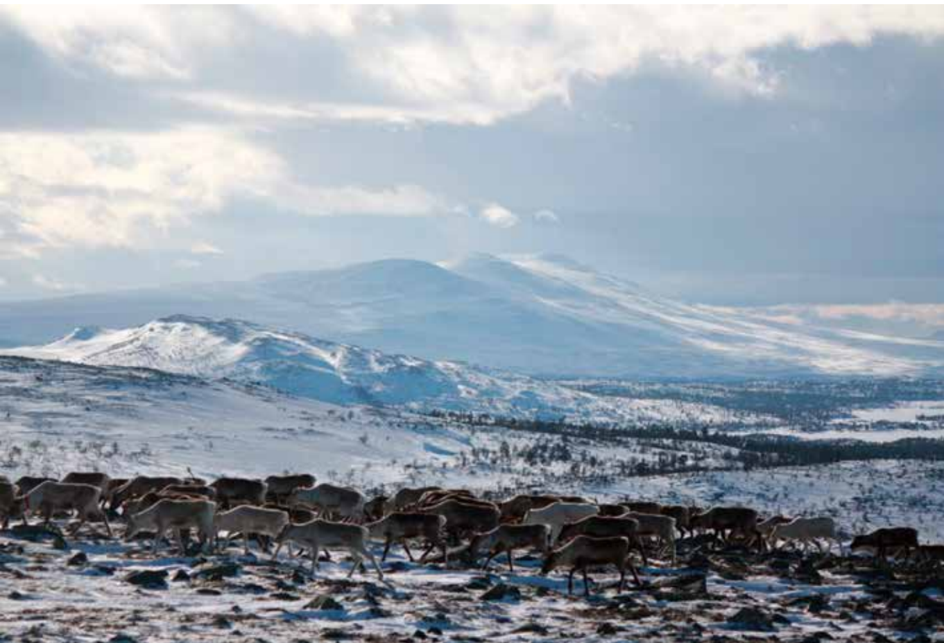
Renar på vårlandet.