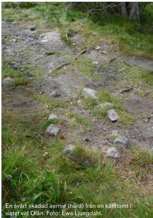
En svårt skadad aerne (härd) från en kåtatomt i vistet vid Olån.

Vid inventering 2011 hittades en förvaringsanläggning uppbyggd av stenar i en sluttning, en kallkälla samt en härd från en kåtatomt intill renvallen. Härden är omgiven av kantstenar och ligger i kanten av en vältrampad turiststig. Härden var svårt skadad av stigen, och kol och sot hade eroderat fram i markytan. Länsstyrelsen i Dalarna beslutade 2013 om en mindre arkeologisk undersökning av härden för att säkra eventuella fynd innan den blev ytterligare förstörd. Datering av en liten enkvist från härden visade att kåtan hade använts någon gång mellan mitten och slutet av 1800-talet. Inga föremål som hade samband med härden eller kåtan kunde