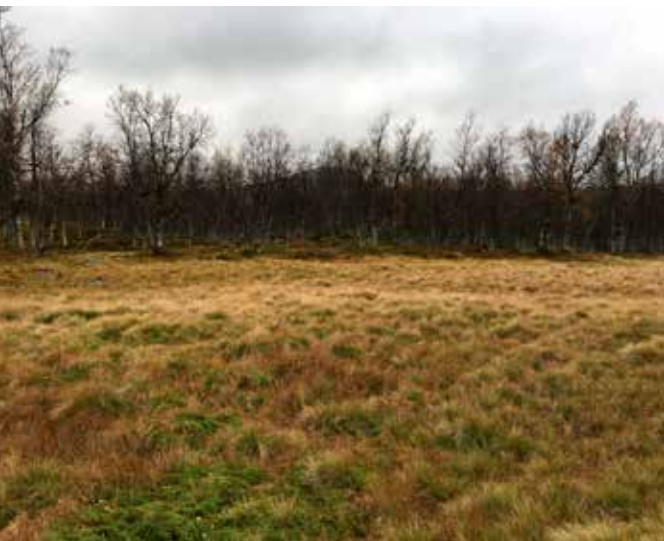
Den frodiga växtligheten på en aevtie (mjölkkningsvall).