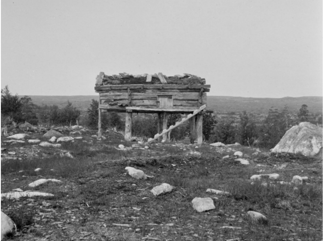
Stolpbod från Noffeldaelie 1912.

turister kunde övernatta där. 1969 var kåtan förfallen och brändes ner av STF, vilket kan tyckas vara besynnerligt.