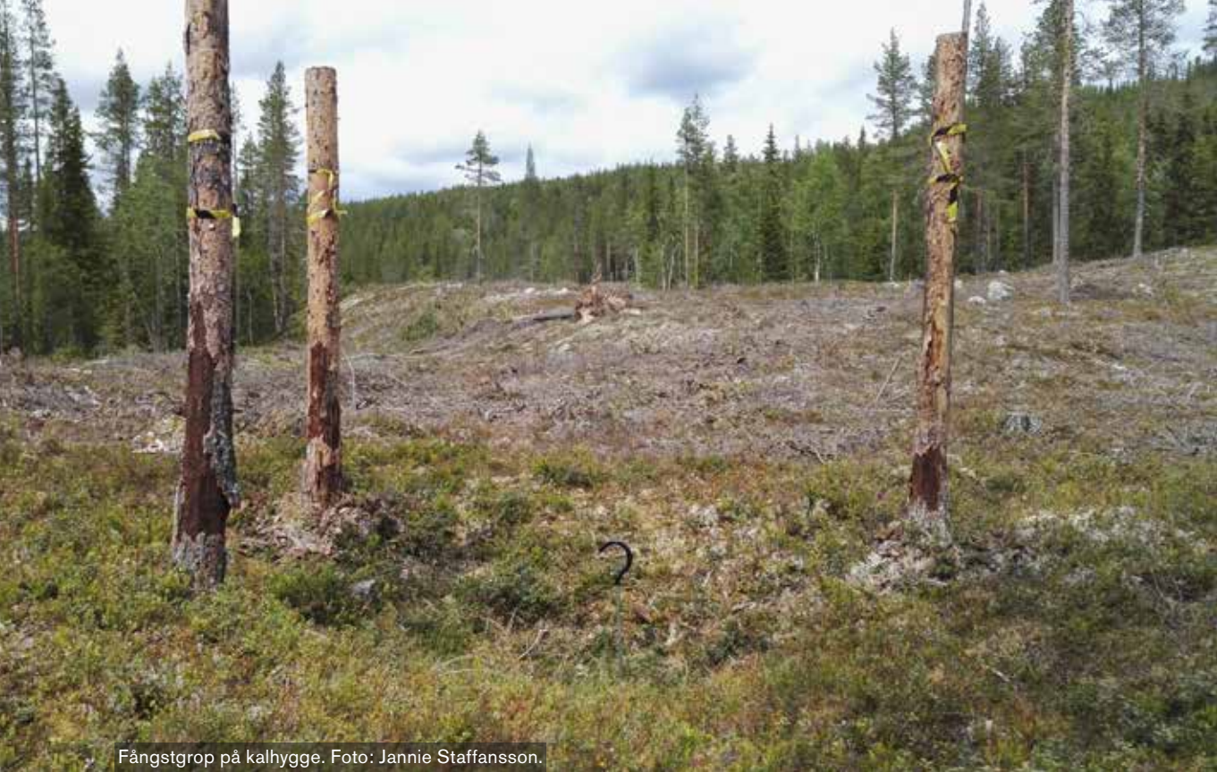
Fångstgrop på kalhygge.

ligger några hundratals meter nordöst om de undersökta kåtatomterna vid Nadden. Kanske hade kåtan samband med utslaktningarna runt år 1900, men den kan även ha en helt annan bakgrund. I området finns många fångstgropar (Ljungdahl 2015).