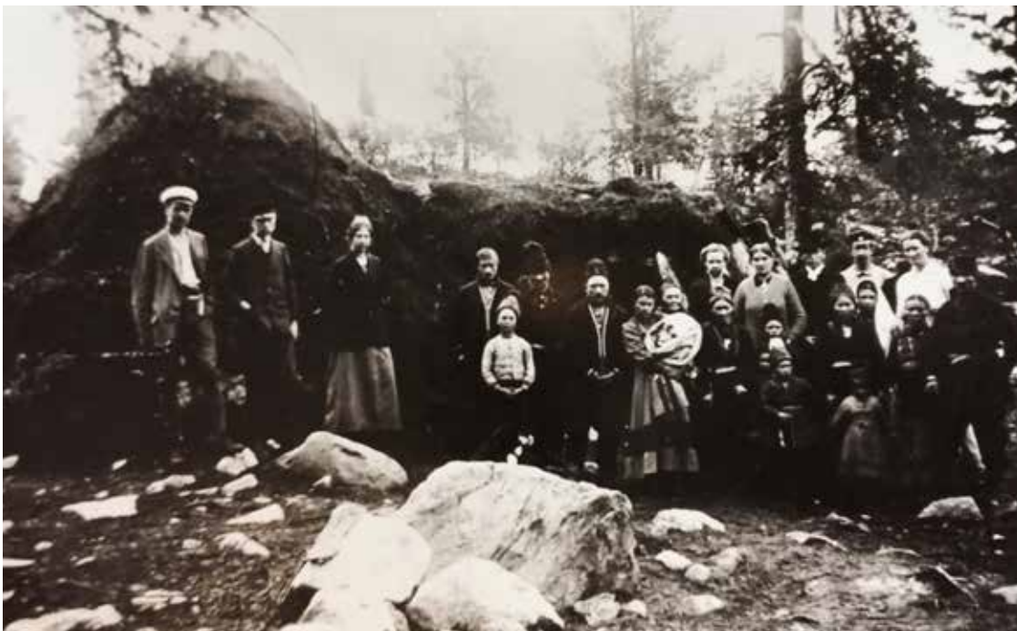
Bild på de samer som bodde i Sluvenvistet 1914.

och Norge fick mycket mark från Särna och Idre. För samerna innebar gränsdragningen inga större skillnader. Så länge de undvek de bofastas byar i de norska dalgångarna kunde renägare från olika trakter fortsätta att samsas om det stora gränslösa höglandet mellan Hede och Femunden. Endast om höstarna skildes renarna åt.