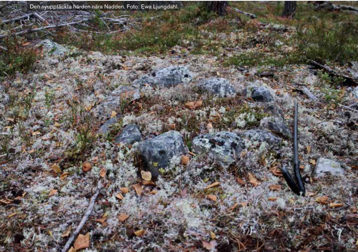
Den nyupptäckta härden nära Nadden.

vilket ledde till konflikter, och samerna skulle ha slaktat ner hela renhjorden, vilket tog en hel vinter. Uppgifterna säger att renskötarna bodde i tillfälliga kåtor vid Grövlan under den vinter när renarna slaktades. De kåatomter som undersöktes 2000 skulle mycket väl kunna vara lämningar efter dessa kåtor. Att det rörde sig om kortvariga bosättningar stöds av att lämningarna var otydliga och saknade tydliga eldstäder. Vid en inventering inför avverkning 2015 påträffades en sedan tidigare okänd härd, som med största sannolikhet har legat inne i en kåta. Härden